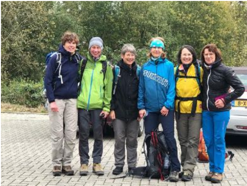
Auf dem Krijtlandpad von Maastricht nach Vijlen....