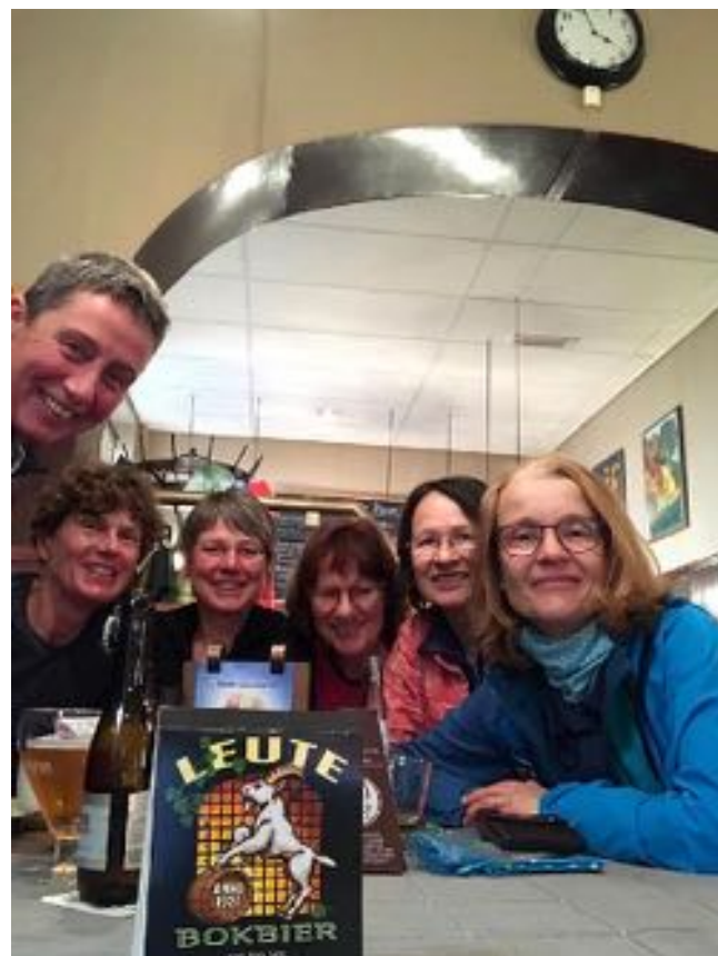
...und beim Kaffee in Gulpen.